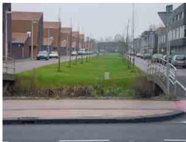
Bovengrondse infiltratievoorziening in leidsche Rijn, Utrecht

Indien mogelijk kan bij overvloedige neerslag het water oppervlakkig afstromen naar de centrale voorzieningen op openbaar terrein grenzend aan het perceel.