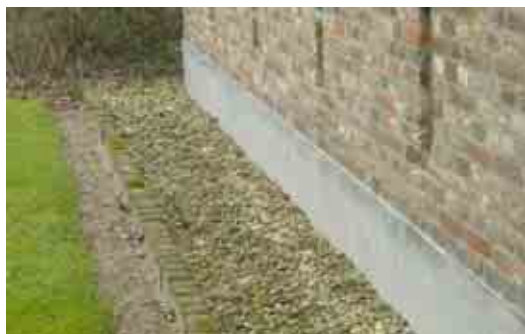
Opvang van hemelwater in grindsleuf direct naast woning

De boven- en onderzijde van de voorziening zijn gerelateerd aan het vloerpeil. De maximale diepte is 1,2 m beneden vloerpeil.